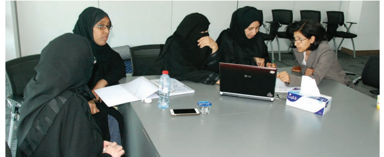
ديي. «أخبار التميز»

تعكف جائزة حمدان بن راشد آل مكتوم للأداء التعليمي المتميز على إعداد نواة تدريبية في مجال الموهبة من خريجي الدبلوم المهني في تربية الموهوبين، متخصصة ومؤهلة علمياً ومرخصة دولياً للتدريب في الميدان التربوي، تنفذ البرامج التدريبية في مجالات الموهبة (الكشف، الرعاية التعليمية، التوجيه والإرشاد، والأنشطة الإثرائية). وتهدف الجائزة من وراء إعداد النواة التدريبية إلى إعداد كوادر مواطنة متخصصة ومؤهلة للتدريب داخل الدولة وخارجها في مجال رعاية الموهوبين، واستثمار قدرات خريجي الدبلوم المهني في تربية الموهوبين في نقل المعرفة إلى المعنيين والمهتمين بمجال رعاية الموهوبين، وتنفيذ البرامج التدريبية في الميدان التربوي في مجالات الاكتشاف والرعاية.